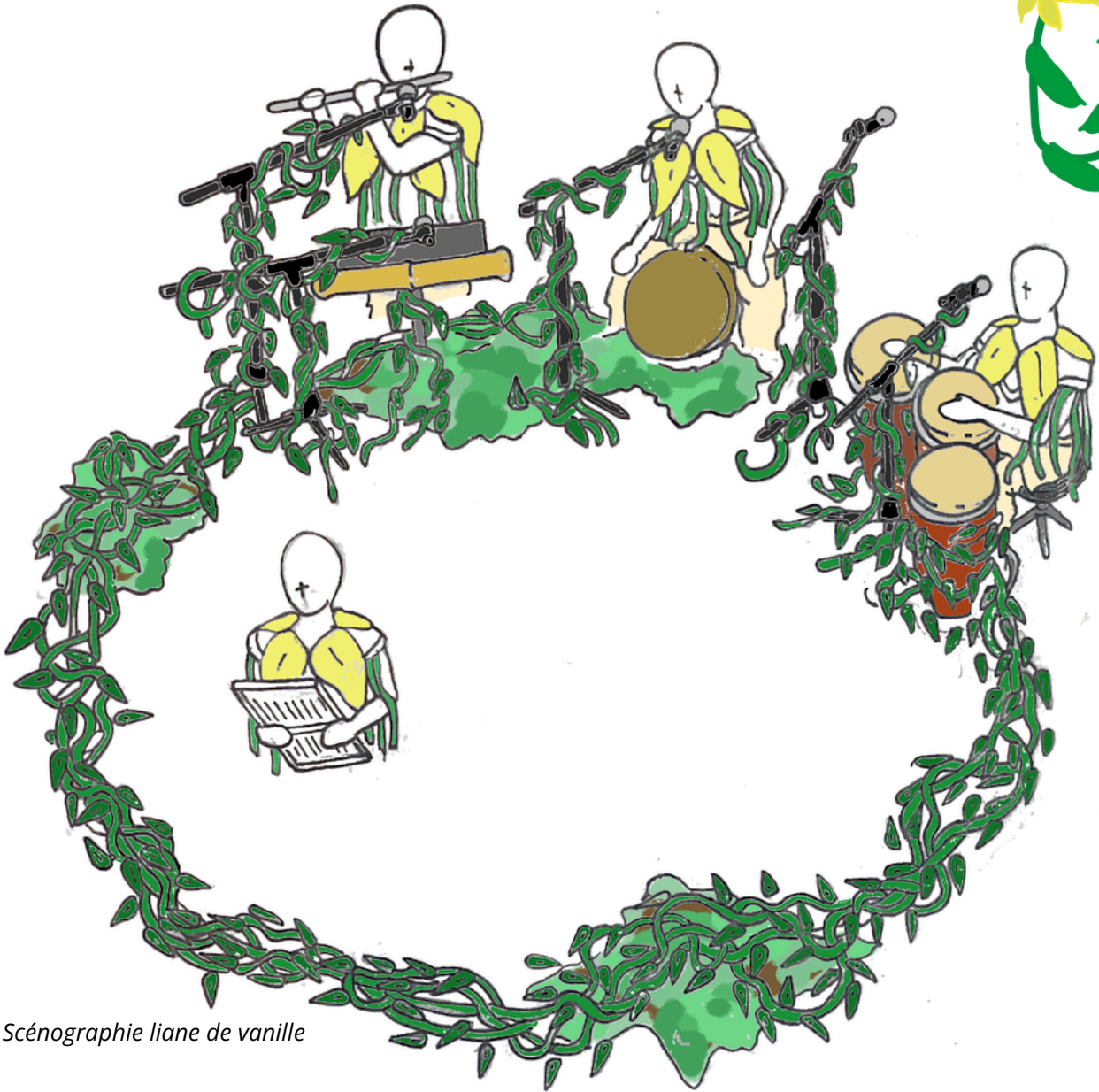
Scénographie liane de vanille